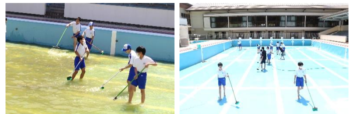
<↑このプールが、こんなにきれいになりました↑>

5月9日(火)、10日(水) プール清掃を行いました。今回は、小学校5年生、6年生も加わり、更衣室やプール周辺など、しっかりと掃除することができました。6月にはプールが始まります。気持ちよく泳ぐことができそうです。