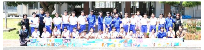
<個性あるブロックができ上がりました>

5月9日(火)、10日(水) プール清掃を行いました。今回は、小学校5年生、6年生も加わり、更衣室やプール周辺など、しっかりと掃除することができました。6月にはプールが始まります。気持ちよく泳ぐことができそうです。